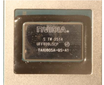
搭載SoC : nVIDIA Thor